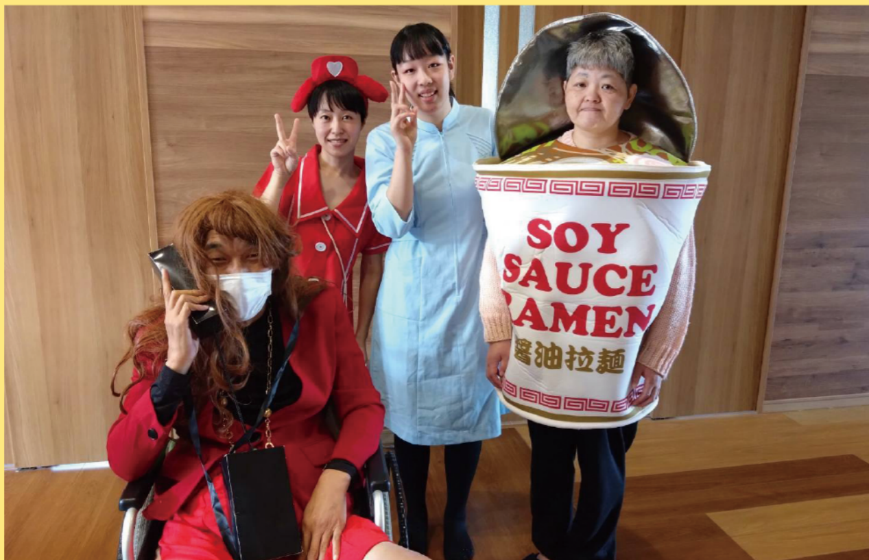
タイトル：ハロウィン仮装 ニックネーム：キャサリン コメント：皆で楽しいことをやってみました！非日常的なことってドキドキする！この中に職員がいますよ。誰かな？