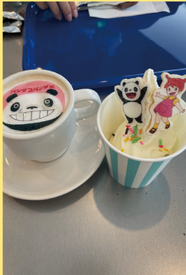
タイトル：石巻マンガ館 ニックネーム：Rituki コメント：パンダコパンダ展に行きました。食べるのかわいそうと言いなから、パンダアイスのパクリ。 息子は、展示より休憩の時間が、楽しそうでした。