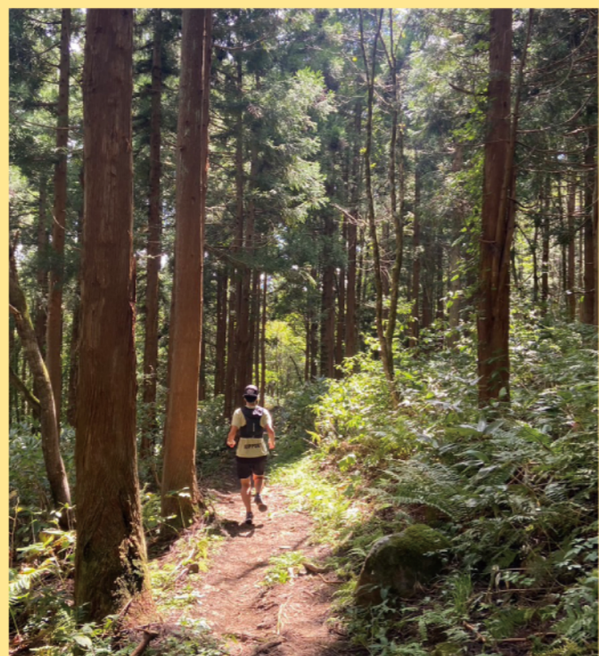
タイトル： 泉ヶ岳トレイルランニング大会 ニックネーム： つくい コメント： 泉ヶ岳トレイルランニング大会の応援に行きました。雨模様での開催が多い本大会ですが今年は天気に恵まれました。