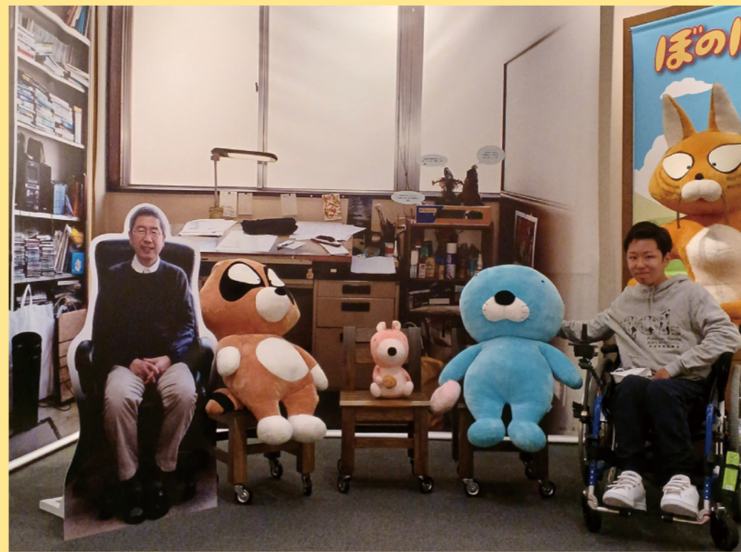
タイトル： 仙台文学館 コメント： コマ漫画『ぼのぼの』の作者いかりしみきお先生のコーナー限定で写真撮影できるので撮ってきました。