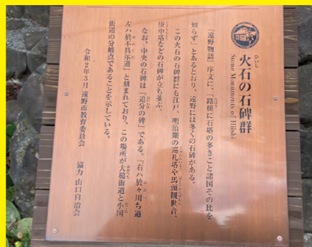
タイトル：岩手県遠野市 ニックネーム：つくい コメント：岩手県の遠野市に散策に行きました。遠野物語で有名な遠野ですが、隣接する地域につながる古い道を示す石碑があちこちに残されており経済の拠点として栄えた往時を偲べます。