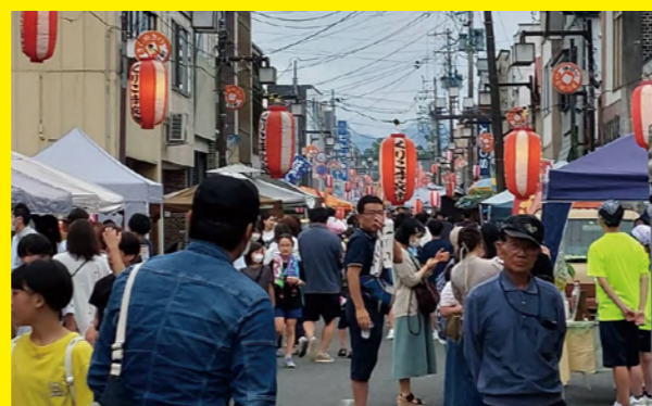
タイトル：栗駒夜市 コメント：今年の栗駒夜市は大盛況！コロナをちょっと気にしながら皆、楽しんでいるように見えました。ビール片手に笑顔で飲みながら、会話を楽しんでいるのが印象的でした。