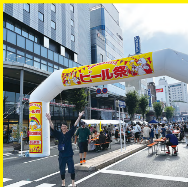
タイトル：郡山ビール祭 ニックネーム：さび コメント：福島県郡山市の夏の風物詩『ビール祭』に参加してきました。コロナ前は開成山公園で開催していたのですが、昨年から郡山駅前を歩行者天国にして再開。規模は大きくなったので楽しかったのですが、前のビール祭も懐かしいな。