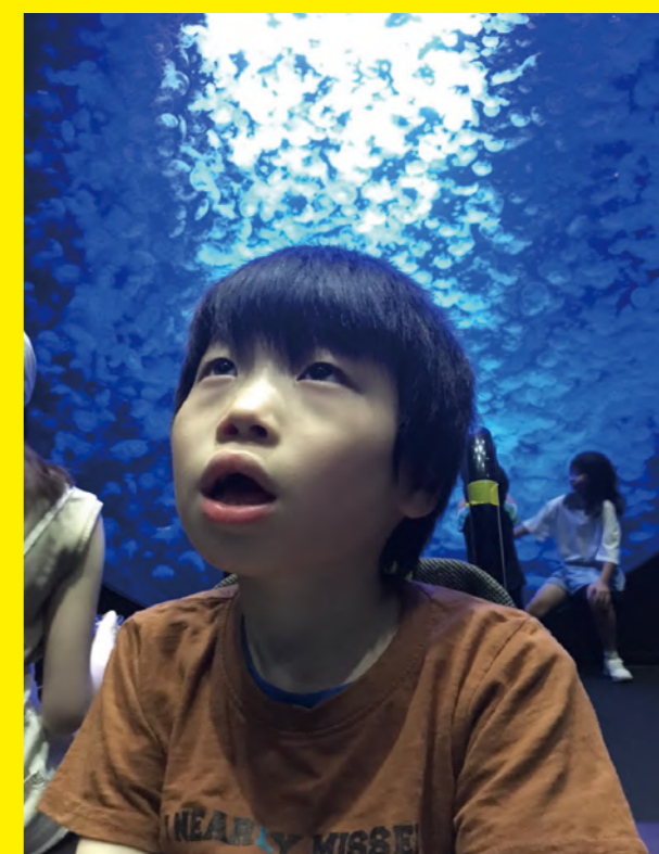
タイトル：久々のお出かけ ニックネーム：Ritu コメント：マイペースな息子に、振り回されて、必死なのは母だけで、楽しんでいたようです。