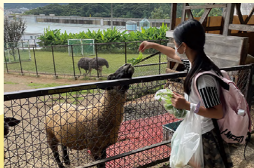
タイトル：もちふた館 ニックネーム：Ritu コメント：野菜をもつ娘には食べたいアピール、野菜を持たない息子には、塩対応。動物も正直ですね。息子はカピバラと相性がいいようです。