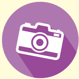
タイトル：アイシングクッキー ニックネーム：チャッピー コメント：喫茶店を運営している就労支援事業所の利用者さんが事業所に提案したお菓子です。凄い才能!採用されるといいですね。