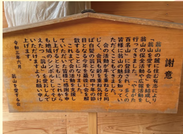
タイトル：翁山 ニックネーム：つくい コメント：山形と宮城の県境にある山です。 昨年、長年登山道の整備をして下さっていた有志の会が解散してしまいました。 山頂からの景色は素晴らしく、これからも引き継がれていって欲しい山です。