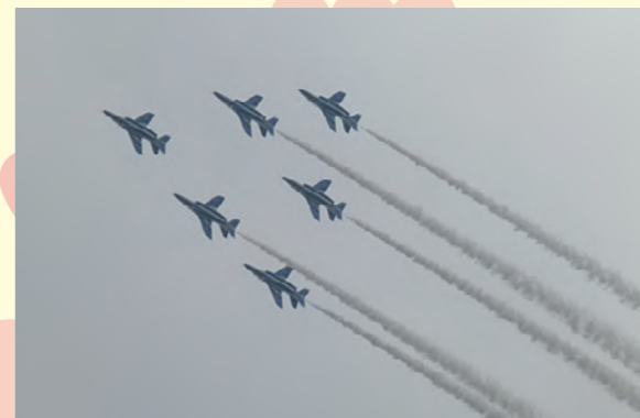
タイトル：ブルーインパルス ニックネーム：ニケ コメント：東松島夏まつりに行ってブルーインパルスを見て来ました。あいにくの曇り空でしたが、いつ見てもブルーインパルスは見事でした。