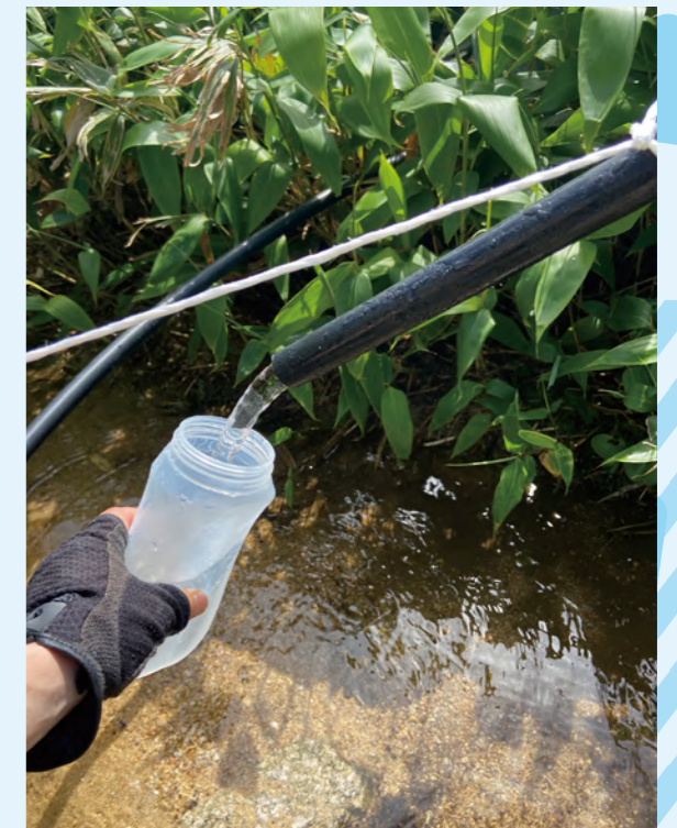
タイトル：朝日連峰 ニックネーム：つくい コメント：朝日連峰の狐穴小屋に行きました。どの登山口からも遠く、小屋までは険しい道のりです。 しかしここに引かれた水はとても冷たくファンは多いです。