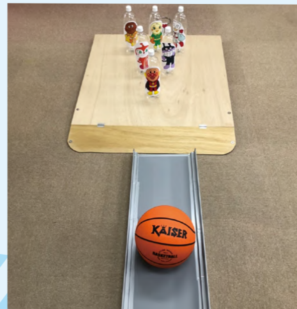
タイトル：ボーリング ニックネーム：加美りらんスタッフ コメント：重症心身障がい児童でも出来るボーリングセット！価格プライスレス。