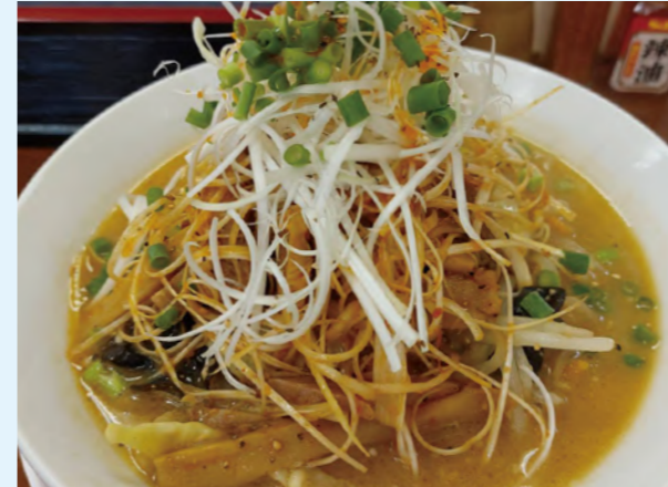
タイトル：麺屋匠 ニックネーム：チャッピー コメント：大崎市にある味噌拉麺とまぜそば専門店。 今度は台湾まぜそばか匠のまぜそばを食べたいと思っています。