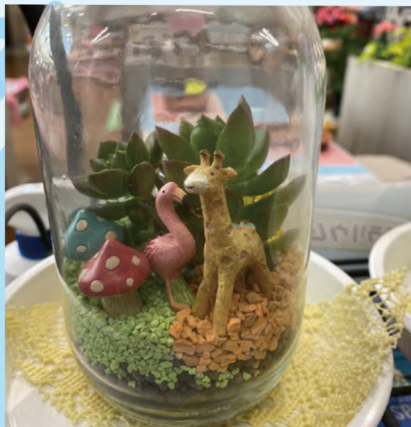
タイトル：ベゴニアガーデン ニックネーム：junya コメント：ベゴニアガーデン最終日に作成した「なんとかなんとか」言う置物です(笑)