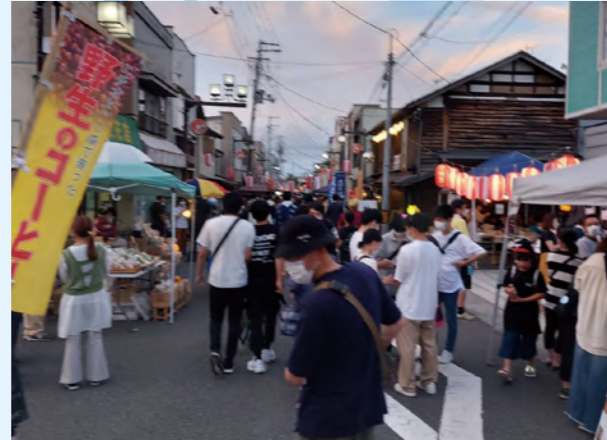
タイトル：くりこま夜市 ニックネーム：チャッピー コメント：「栗駒山の麓、岩ヶ崎地区、六日町通り商店街のファン感謝デー的イベントが3年振りに復活」らしいです。8/13にも開催するみたいです。