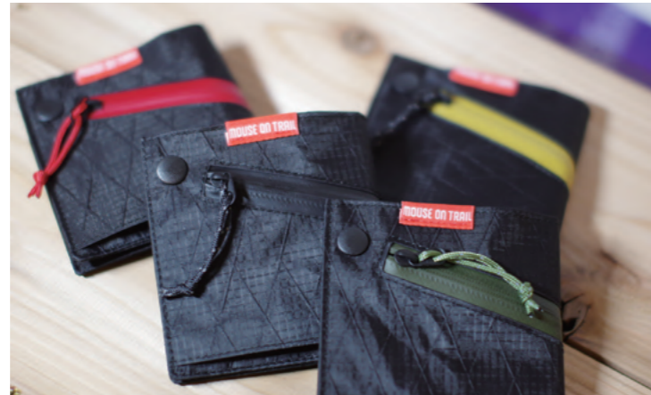
商品名：アウトドアウォレット 料金：4,860円(税込) 説明：アウトドアウォレットはいろいろなブランドから発売されているが、ほとんどの商品が小さいだけで使いにくい。小銭を入れるファスナーを斜めに配置することで、折り曲げたときのごわつきを少なくしています。お札が取り出しやすいように加工もしています。簡易防水仕様になっています。