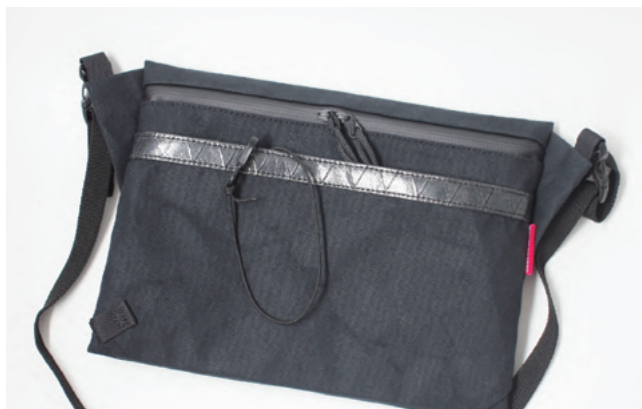
mouse on trail オリジナル商品 商品名：走れるサコッシュ 料金：5,500円(税込) 説明：サコッシュとは、スマホや行動食などすぐに取り出したいものを入れる小さいバック。今は登山者が使う道具として広がっていますが、本来はロードバイクに乗る人が使っていたもの。この商品は当店オリジナルの商品で、走ってもぶれないようにコードで止められるようになっています。