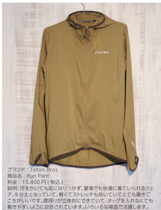
ブランド：Teton Bros 商品名：Run Pant 料金：15,400円(税込) 説明：汗をかいても肌にはりつかず、夏場でも快適に着られるウェア。9分丈となっていて、軽くてストレッチも効いていてとても履きごちがいです。膝周りが立体的にできていて、タックを入れなくても動きやすいように設計されています。いろいろな場面で活躍します。