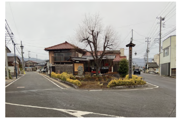
タイトル：奥羽街道羽州街道追分 ニックネーム：つくい コメント：福島県桑折町の奥羽街道羽州街道追分を見学しました。江戸時代、ここで別れた道は遠く青森県で 再び合流します。桑折駅前を中心に旧街道の案内が充実しており往時を偲ぶ静かな時間を過ごすことができました。