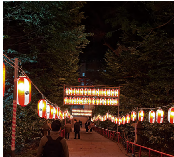
タイトル：とんと祭 ニックネーム：ティ コメント:今年もとんと祭に行ってきました。コロナも落ち着いてきているからか、とても人が多かったです。