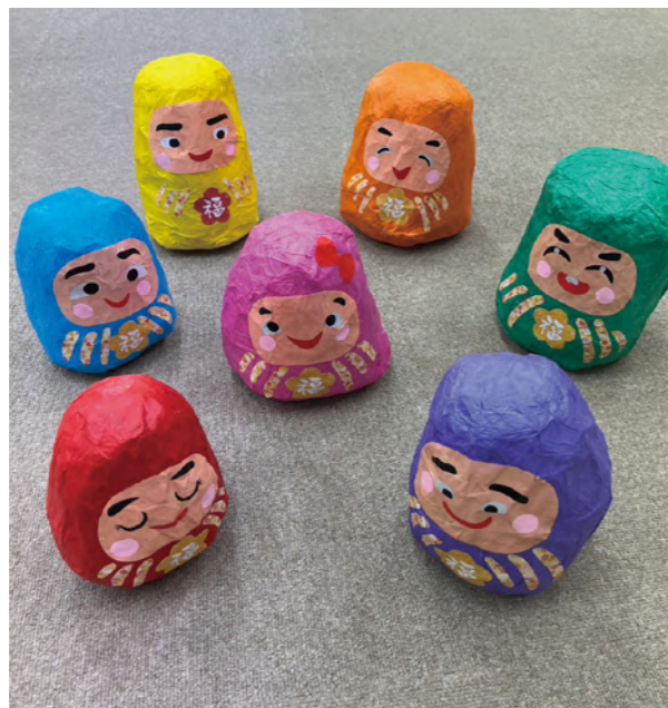
タイトル：福だるま ニックネーム：加美町りらん