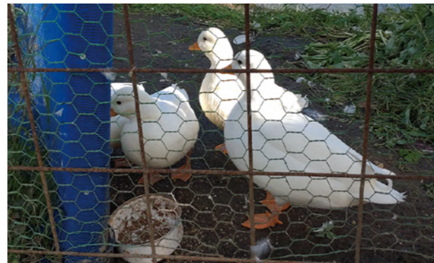
タイトル：可愛い仲良しアヒル ニックネーム：まさかり担いだ金太郎 コメント：「アヒルの行列」ならぬ「アヒルの集合」?! いつも4匹一緒に行動しています♪