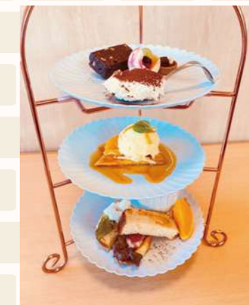
アフタヌーンティー