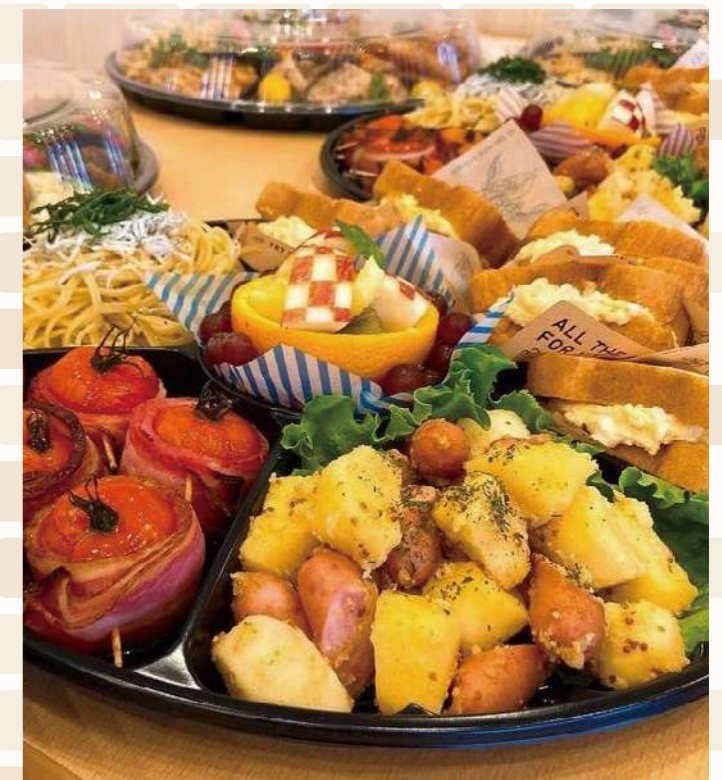
しあわせcafeオードブル ■1シート(小サイズ)…¥3,500(税込) ■1シート…¥6,000(税込) ■2シート…¥10,000(税込) ※要予約(日、祝を除く3日前まで) ※引渡し時間: 11:00～15:30まで