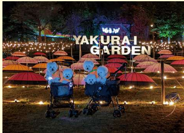
タイトル：やくらいガーデンハロウィン ニックネーム：クリスタルソフィア犬舎 コメント:ビションブリーゼです。10/31やくらいガーデンハロウィンに行ってきました。みんなハロウィン!可愛い!