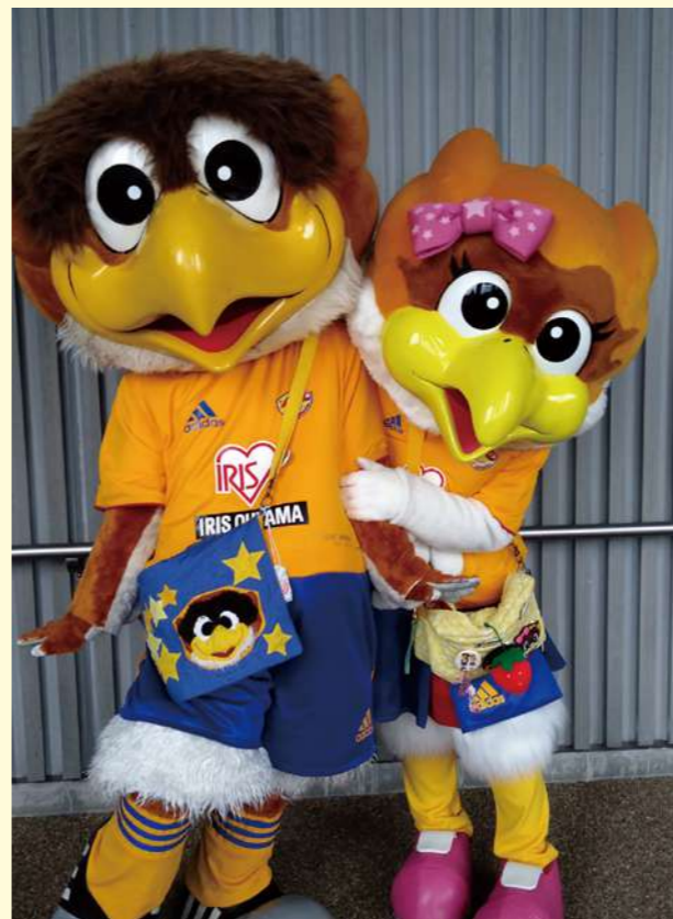
タイトル：ベガルタ兄妹 ニックネーム：ニケ コメント：ベガルタ仙台のマスコット「ベガッ太くん」と ルターナちゃん」です。