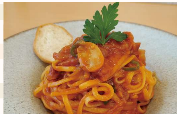
ナポリタン ■単品 ¥850(税込)

また、アフタヌーンティーをスタートする予定です。アフタヌーンティーはイギリスの貴族の習慣で、午後には紅茶と共に軽食やおやつを楽しむものです。どちらも楽しみにお待ちください。また、特製のオードブルも販売しています。小さなお子さんがいる3人家族用に小サイズのものも作りました。クリスマスや年末のおうちパーティーにぜひご利用ください。料理の価格もできるだけお手頃にして、気軽に美味しい食事を食べられるように工夫しています。このような料理は仙台に行かないとなかなか食べることができないので、大崎でも食べられるということが自慢のお店にしていきたいと思えます。