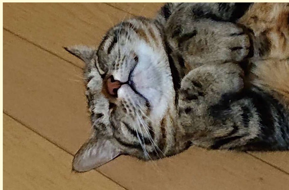
タイトル：くらのヒルね。 ニックネーム：加美はなこ コメント：うちの愛猫は、なんの夢を見るのかな?