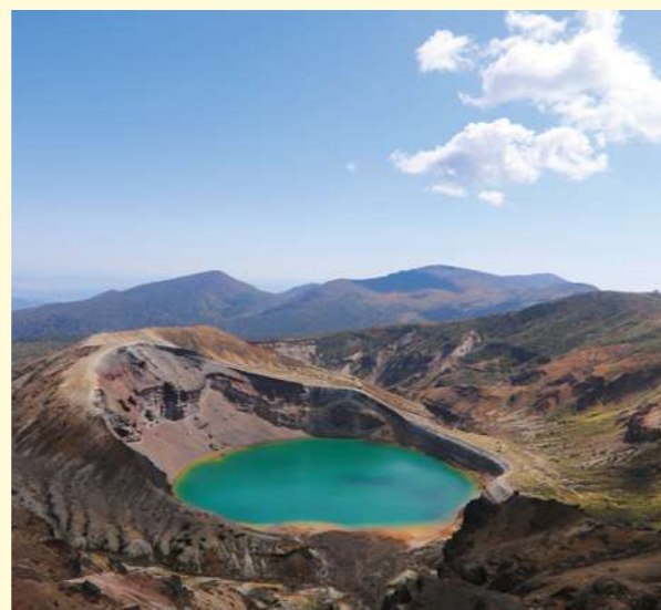
タイトル：蔵王のお釜 ～熊野岳より～ ニックネーム：けっぺい コメント：10月の初めに、熊野岳から今までで一番きれいな お釜を眺める事ができました。