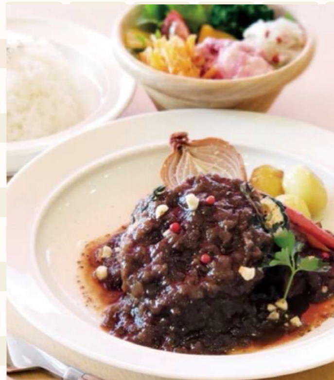
国産豚のバルサミコ煮込み ■サラダ・ドリンクセット…¥1,350(税込) ■3点セット(サラダ・ドリンク・日替わりデザート)…¥1,600(税込)