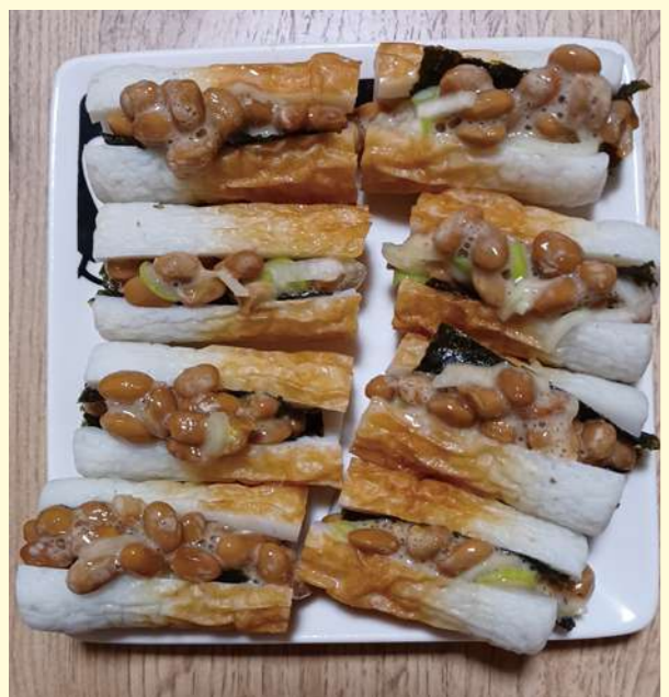
タイトル：ちくわ納豆 ニックネーム：冷蔵庫開けたい コメント：たんぱく質多めのおつまみ作りました