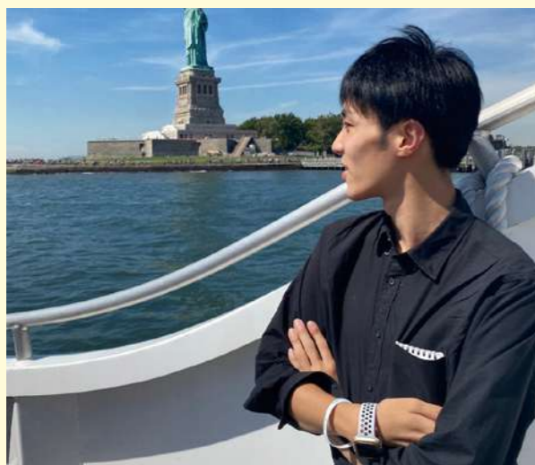
タイトル：ニューヨーク ニックネーム：まる コメント：一人旅